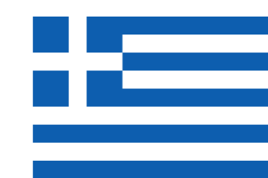
Greece Pi Private Company