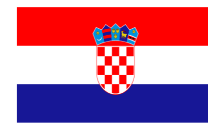
Croația Sveučiliste U Zagreb University of Zagreb