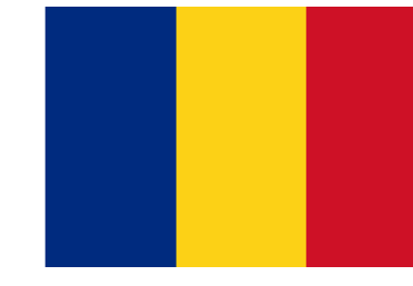
România Universitatea din Craiova University of Craiova