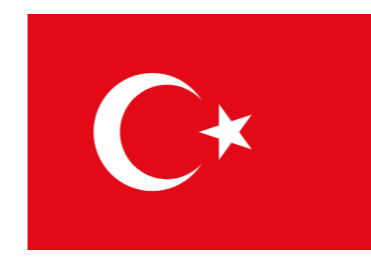
Turcia Tarsus Üniversitesi Tarsus University

Șapte instituții din Turcia, Belgia, România, Irlanda, Germania, Croația și Grecia, care au experiență în domeniul STEM fac sunt implicate în proiectul STEM in Action project.