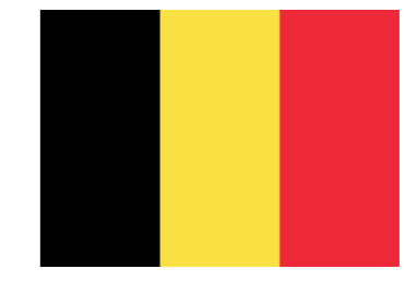
Belgia Katholieke Hogeschool Vives Zuid Katholik Highschool Vives Zuid