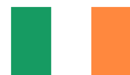
Irland Cork Institute of technology