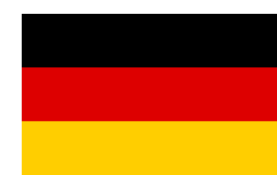
Germany Universität Paderborn University Paderborn